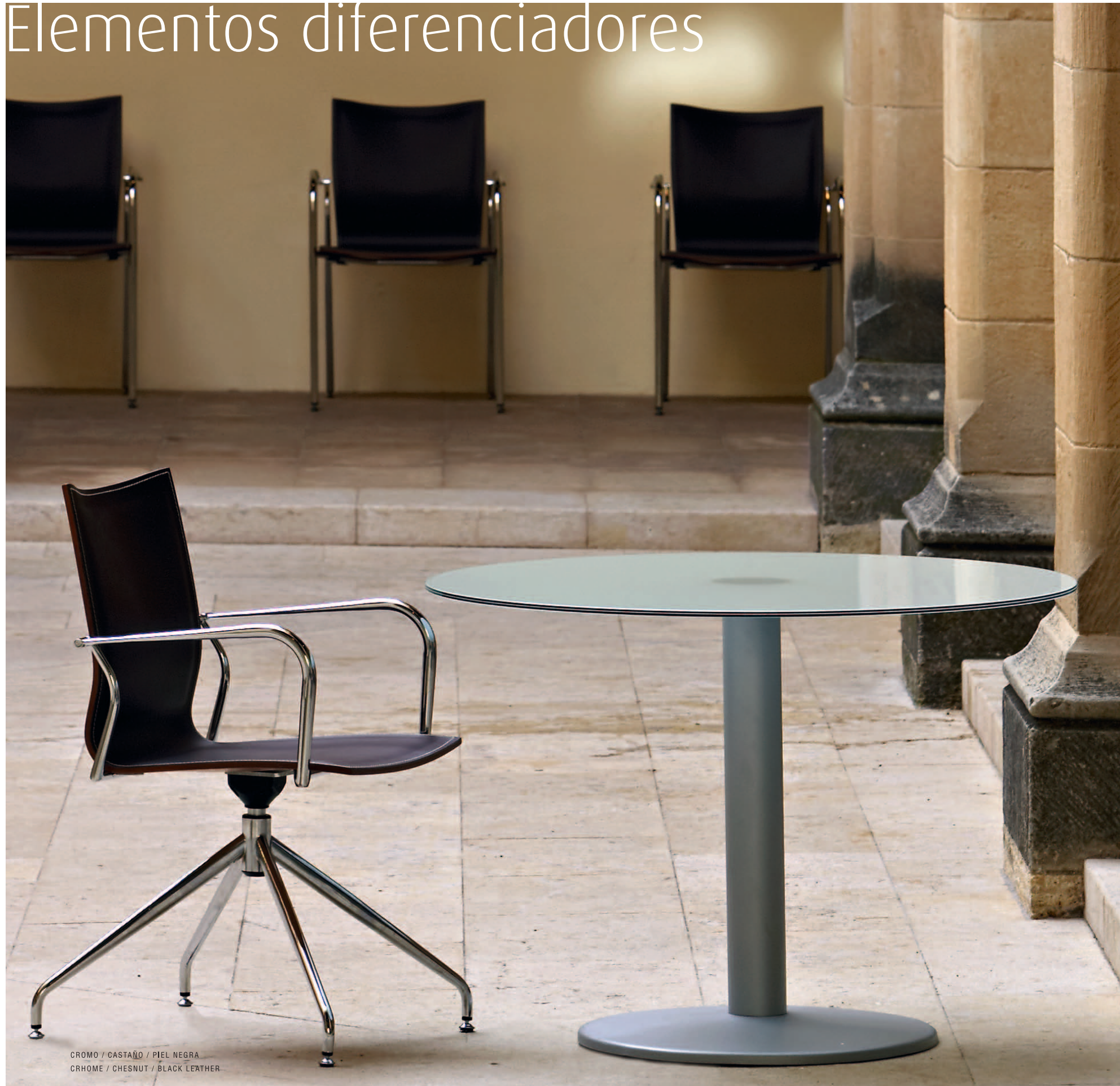
CROMO / CASTAÑO / PIEL NEGRA CHROME / CHESNUT / BLACK LEATHER