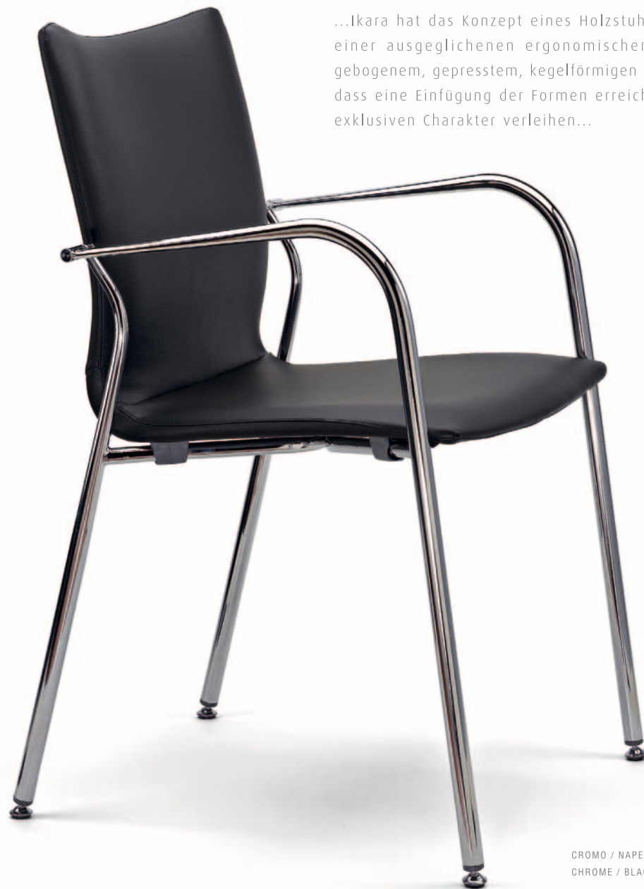
CROMO / NAPEL NEGRO CHROME / BLACK LEATHER LOOK