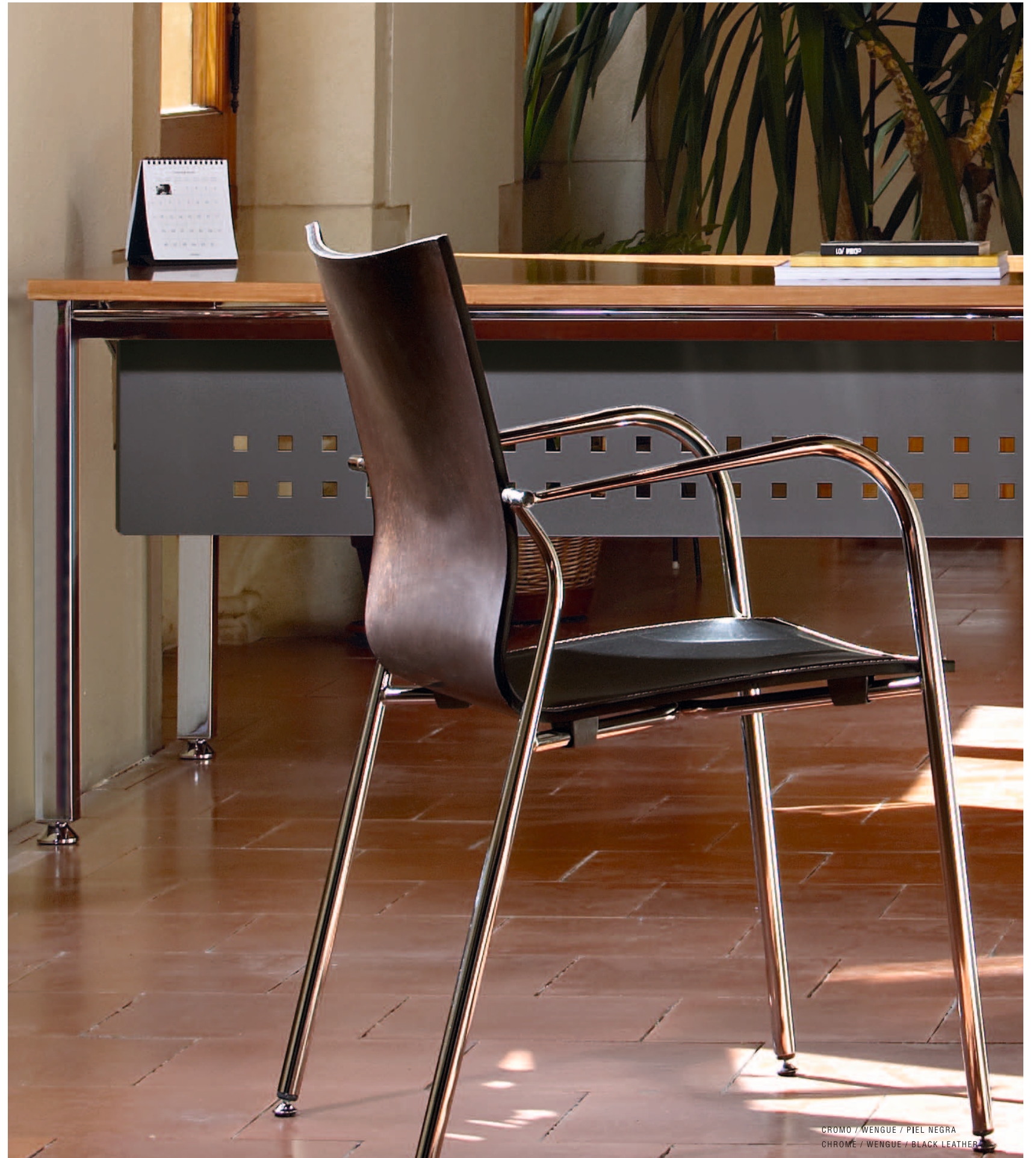
CROMO / WENGUE / PIEL NEGRA CHROME / WENGUE / BLACK LEATHER