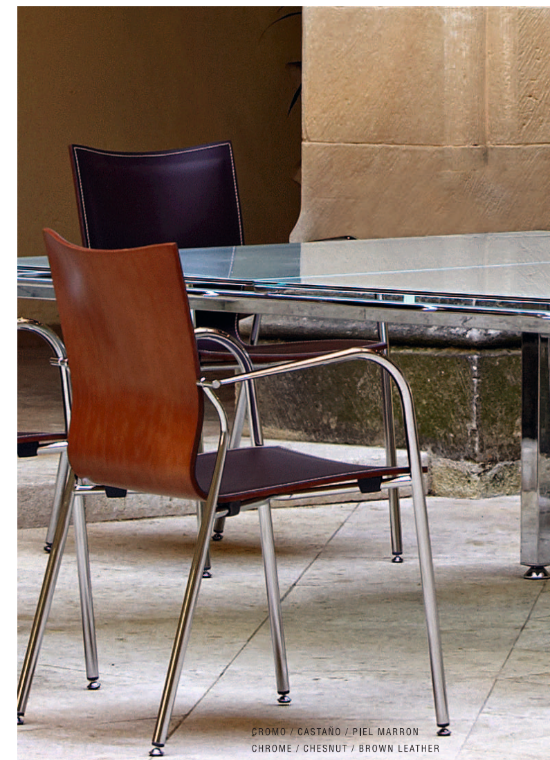
CROMO / CASTAÑO / PIEL MARRON CHROME / CHESNUT / BROWN LEATHER