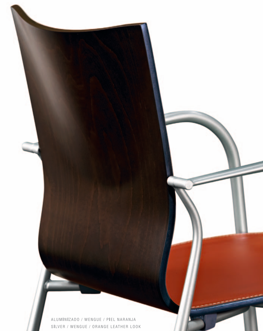
ALUMINIZADO / WENGUE / PIEL NARANJA SILVER / WENGUE / ORANGE LEATHER LOOK