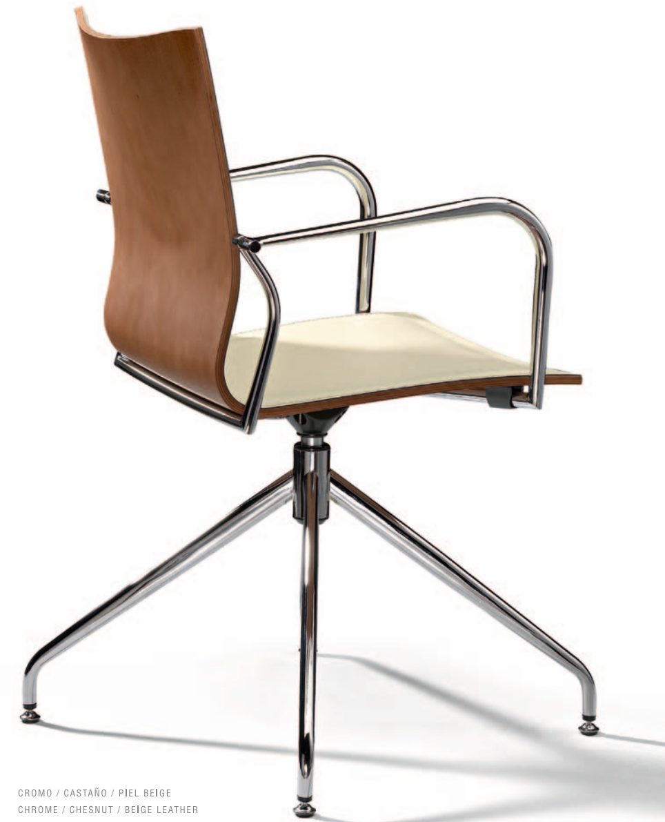
CROMO / CASTAÑO / PIEL BEIGE CHROME / CHESNUT / BEIGE LEATHER