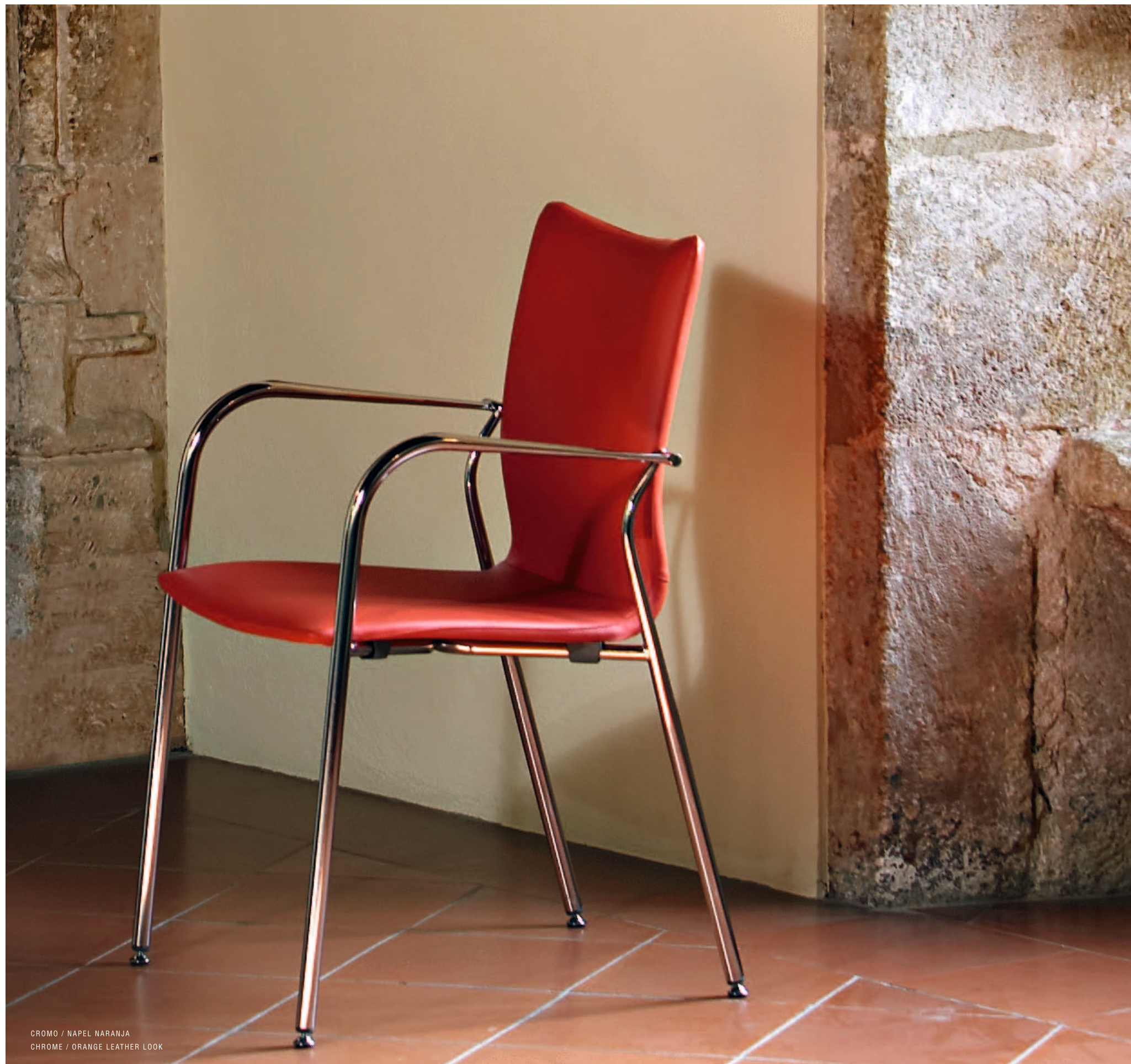
CROMO / NAPEL NARANJA CHROME / ORANGE LEATHER LOOK