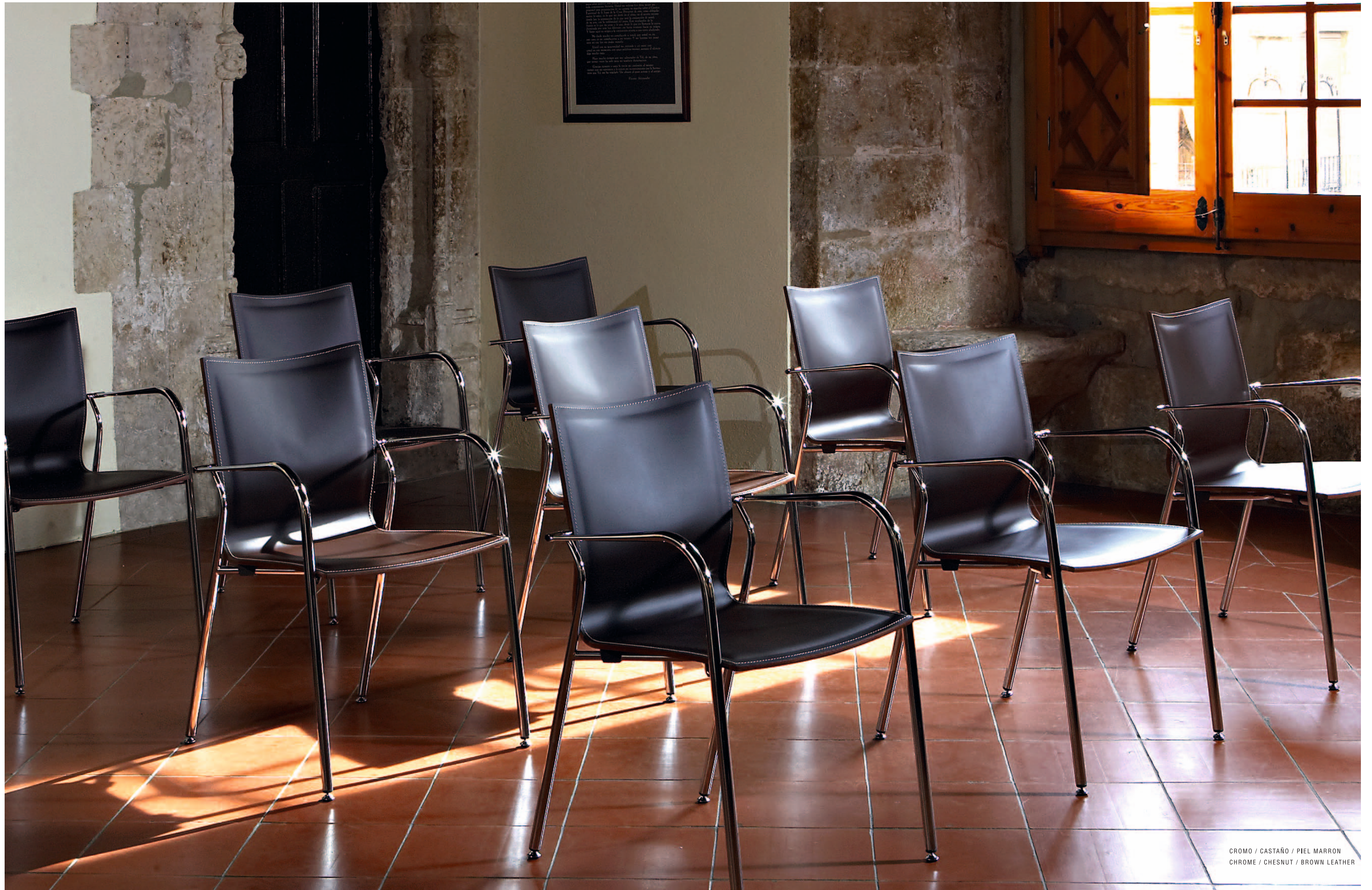
CROMO / CASTAÑO / PIEL MARRON CHROME / CHESNUT / BROWN LEATHER