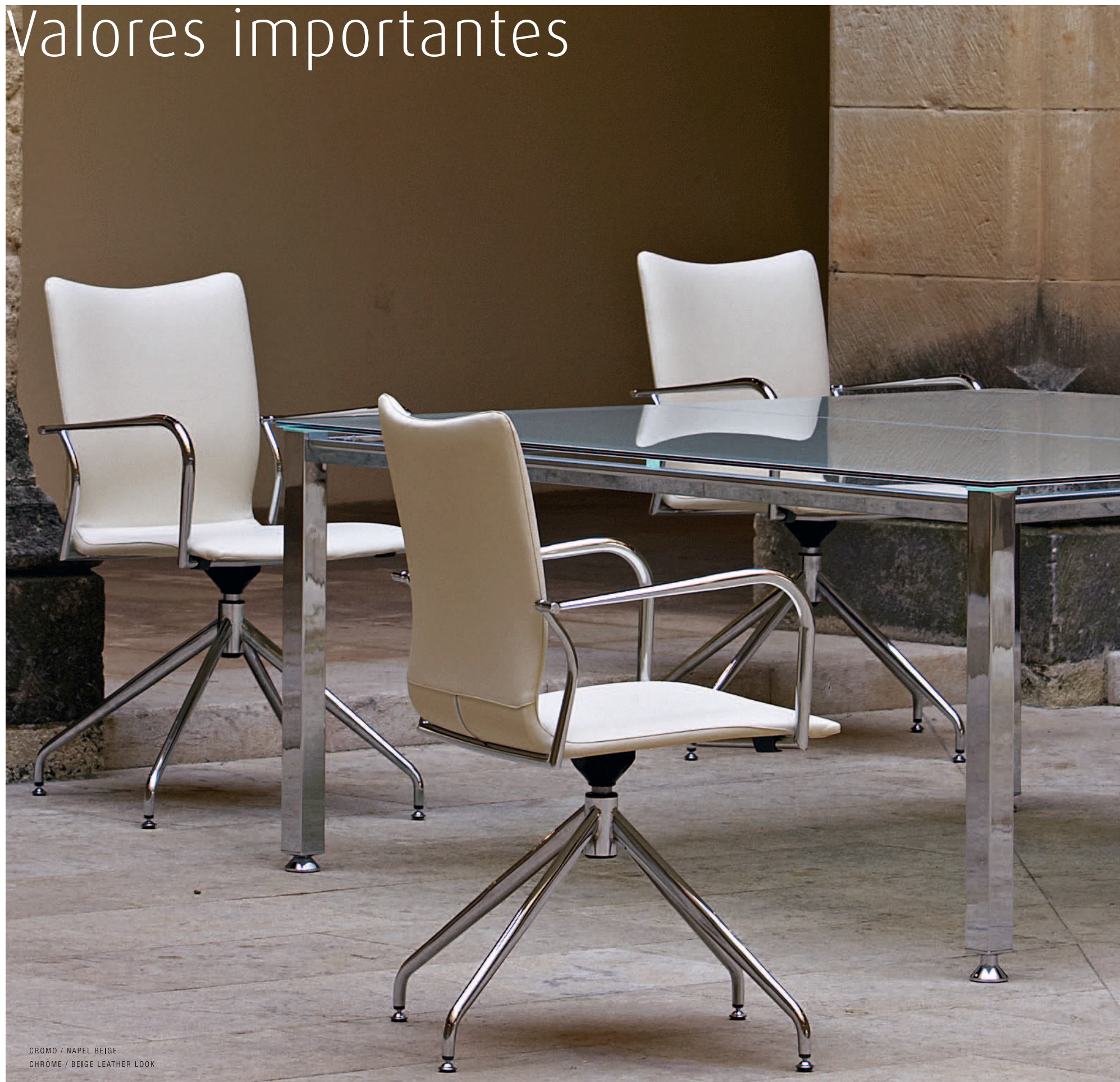
CROMO / NAPEL BEIGE CHROME / BEIGE LEATHER LOOK